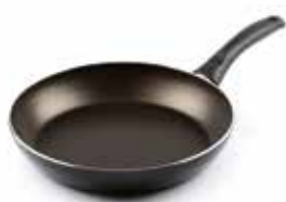
Padella alta Ø 20 cm D73PA2000 Deep fry pan Ø 24 cm D73PA2400 Hohe Bratpfanne Ø 28 cm D73PA2800 Poêle haute Ø 32 cm D73PA3200