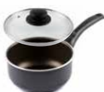
Casseruola un manico Ø 16 cm D73C11600 Saucepan Ø 16 cm D73CZ1600 Stielkasserole Casserole Cazo