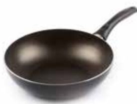
Wok Ø 24 cm D73WK2400 Stir fry pan Ø 28 cm D73WK2800 Wokpfanne Poêle wok Wok