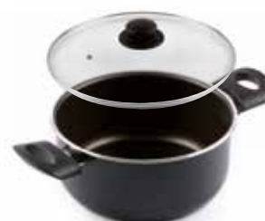
Casseruola due maniglie Ø 20 cm Dutch Oven Ø 24 cm Bratentopf Ø 20 cm Faitout Ø 24 cm Cacerola