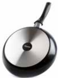
ASPETTO DEL FONDO BASE APPEARANCE

A SUCCESSFUL CLASSIC. THE BLU IRIS RANGE FEATURES A CLASSY MATT BLUE EXTERIOR AND THE RELIABILITY OF TEFLON CLASSIC® NONSTICK INTERIOR. ERGONOMIC AND SAFE GRIP ARE ENSURED BY ITS SOFT TOUCH HANDLES, WHILE THE RANGE IS SUITABLE FOR ALL HEATING SOURCES (EXCEPT INDUCTION). EVERY ITEM IN THE RANGE CAN BE USED FOR COOKING, REFRIGERATING AND RE-HEATING FOOD, AND IS FULLY DISHWASHER SAFE. MADE IN ITALY.