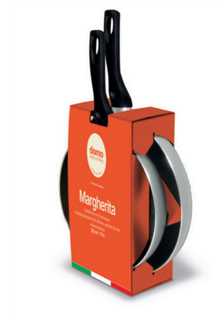
Set of two pans Set 2 padelle