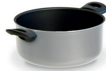
Dutch oven Casseruola a due maniglie