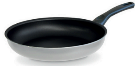
Deep fry pan Padella alta