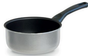
Saucepan Casseruola un manico