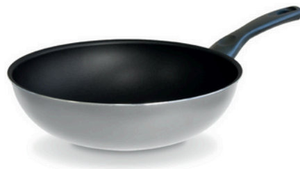
Stir fry pan Wok